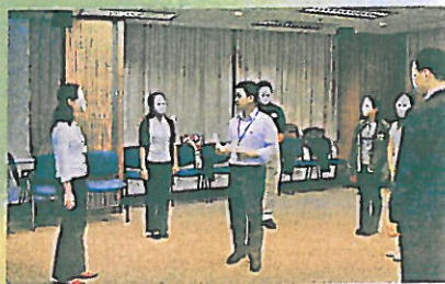
▲發言者脫下面具後，逐一走到學員面前講話。

「原意是加強學員公開說話的信心，強化身體語言表達力。透過說出真正屬於自己的說話，藉着內容和眼神，投射出個人魅力，無論對方身份為何，也不受其表情所影響。」