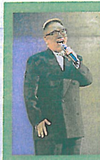
▲黃霑亦在熒幕上講粗口。

「好似黃霑，很多人都知道他時常講粗口，但在熒幕上永聽不到他說一句，這就是功力。無論說甚麼，都要訓練自己先想清楚確實意思，才表達出來，戲劇訓練正是要加強這 7% 的語言說服力。」